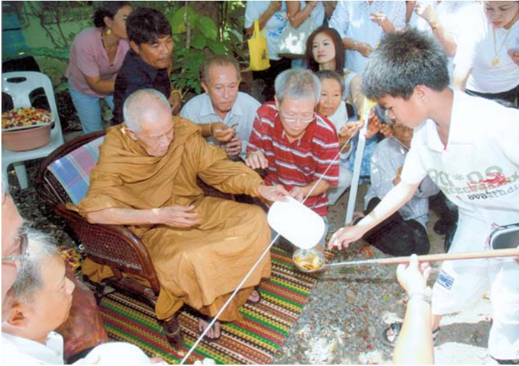
พิธีเททอง ณ ศูนย์ศิลปกรรมวิเชียรเขตต์