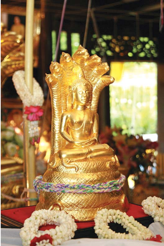
พระพุทธสิริสัตตราช (หลวงพ่ोजีตักขัตติย์) องค์จริง ถ่าย ณ บ้านเรือนไทย ลาดพร้าว กรุงเทพมหานคร ๕ สิงหาคม ๒๕๕๐