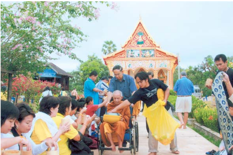
หลวงปู่ปรับบิณฑบาตด้านหน้าอุโบสถวัดอำมาตยาราม แขวงจำปาสัก