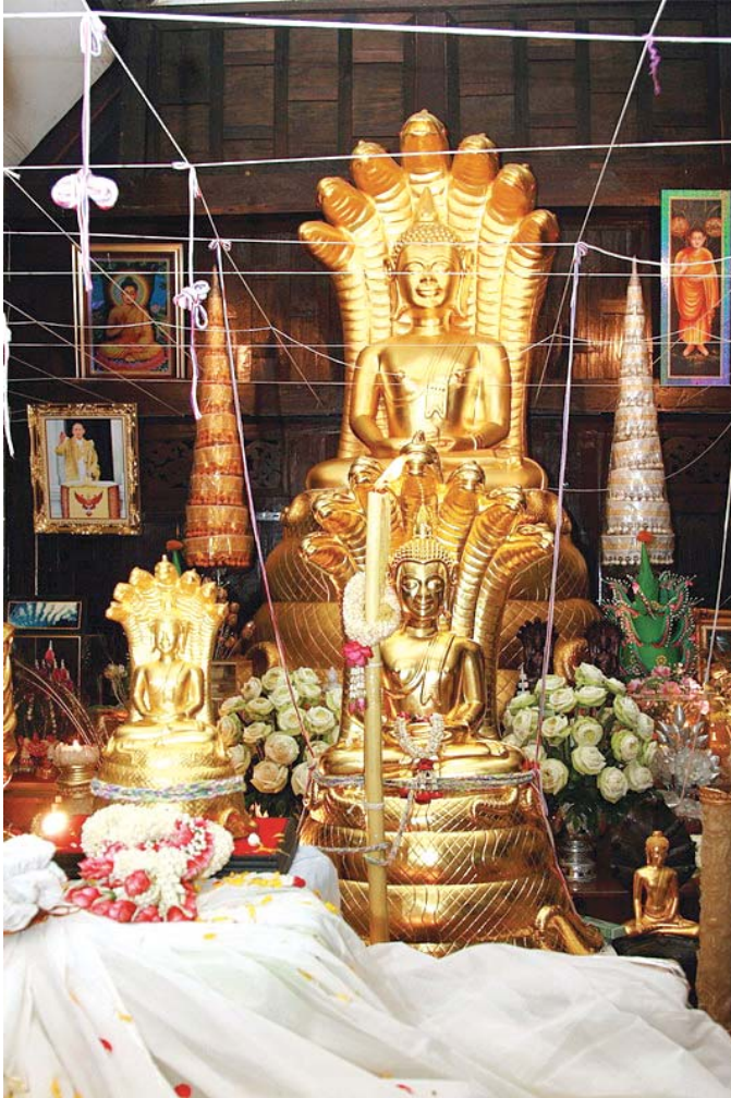
พระพุทธสิริสัตตราช (หลวงพ่อเจ็ดกษัตริย์) องค์จริง (องค์ซ้ายมือ) และพระพุทธสิริสัตตราช (หลวงพ่อเจ็ดกษัตริย์) จำลอง ถ่าย ณ บ้านเรือนไทย ลาดพร้าว กรุงเทพมหานคร ๕ สิงหาคม ๒๕๕๐