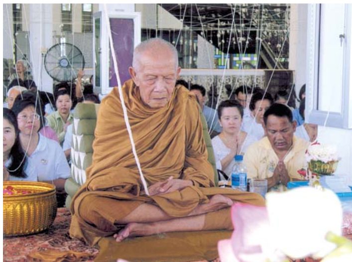
หลวงปู่สอ พันธุโล นั่งปรกอธิษฐานจิตในพิธีพุทธธาภิเษก ภาพถ่ายล่าสุด เมื่อ ๗ มิถุนายน ๒๕๕๑ ณ โรงหล่อแหลมสิงห์