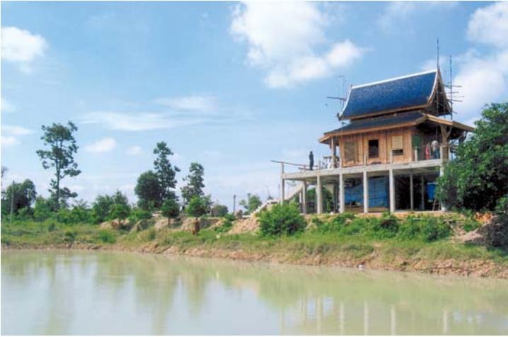
มณฑปที่กำลังก่อสร้าง