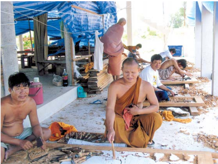
แกะสลักเป็นเรื่องราวเกี่ยวกับประวัติหลวงปู่สอ